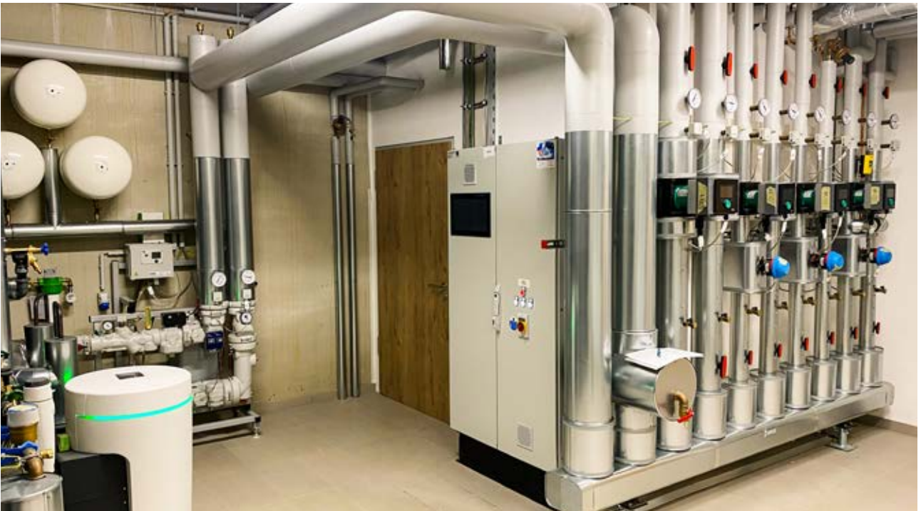
Heizen: Vorgefertigte Energieverteilung mit Fernwärmearbeitung