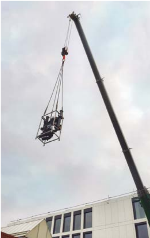
Kranung vorgefertigter Einzelmodule für eine Energiezentrale