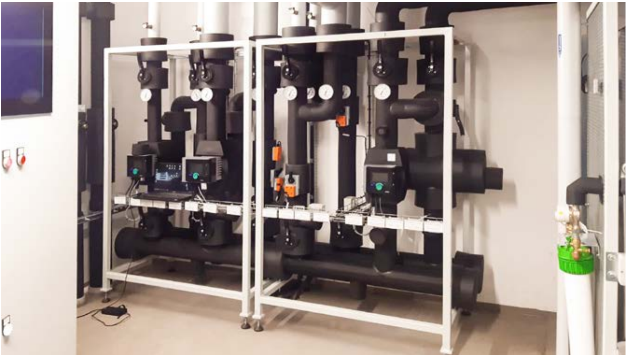
Heizen und Kühlen: Vorgefertigte Verteilermodule