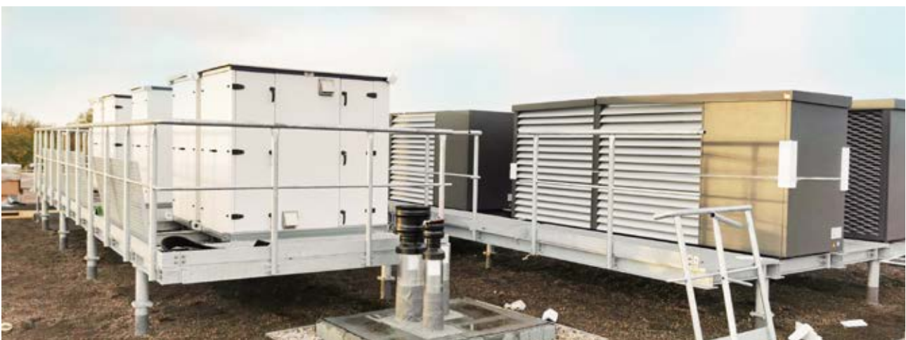
Aufgestellte IDM-Trennstationen für eine IDM-Luft-Wärmepumpen