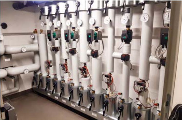
Heizen: Vorgefertigter Energieverteiler