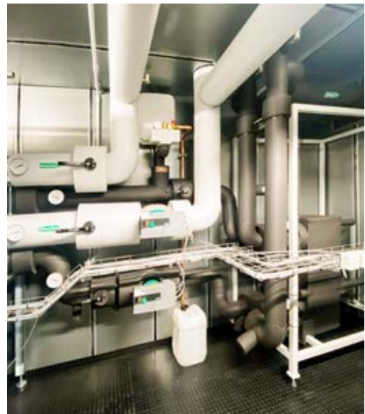
Sole- und Heizkreisseitiger Wärmepumpenanschluss mit Trenntauscher-Modul