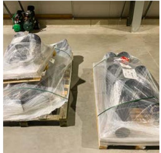
Vorgefertigte Rohrbaugruppen zur Herstellung einer modularen Energiezentrale