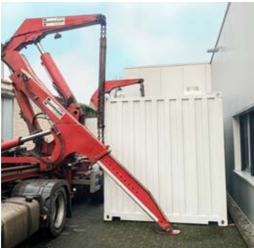
Spezialtransport einer Container-Energiezentrale