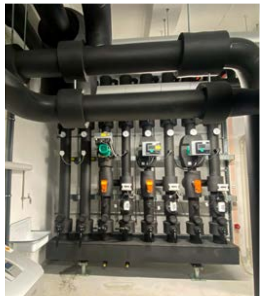
Kühlen: Vorgefertigter Energieverteiler