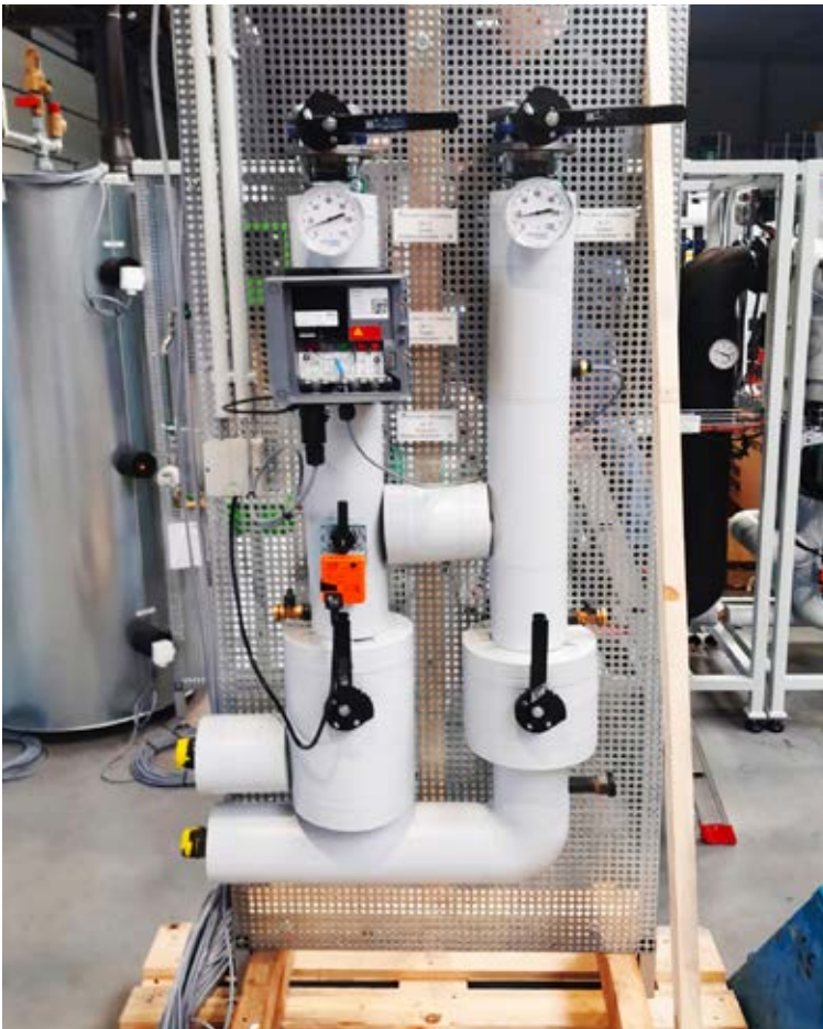
Modulare Heizkreiserweiterung für eine modulare Energiezentrale