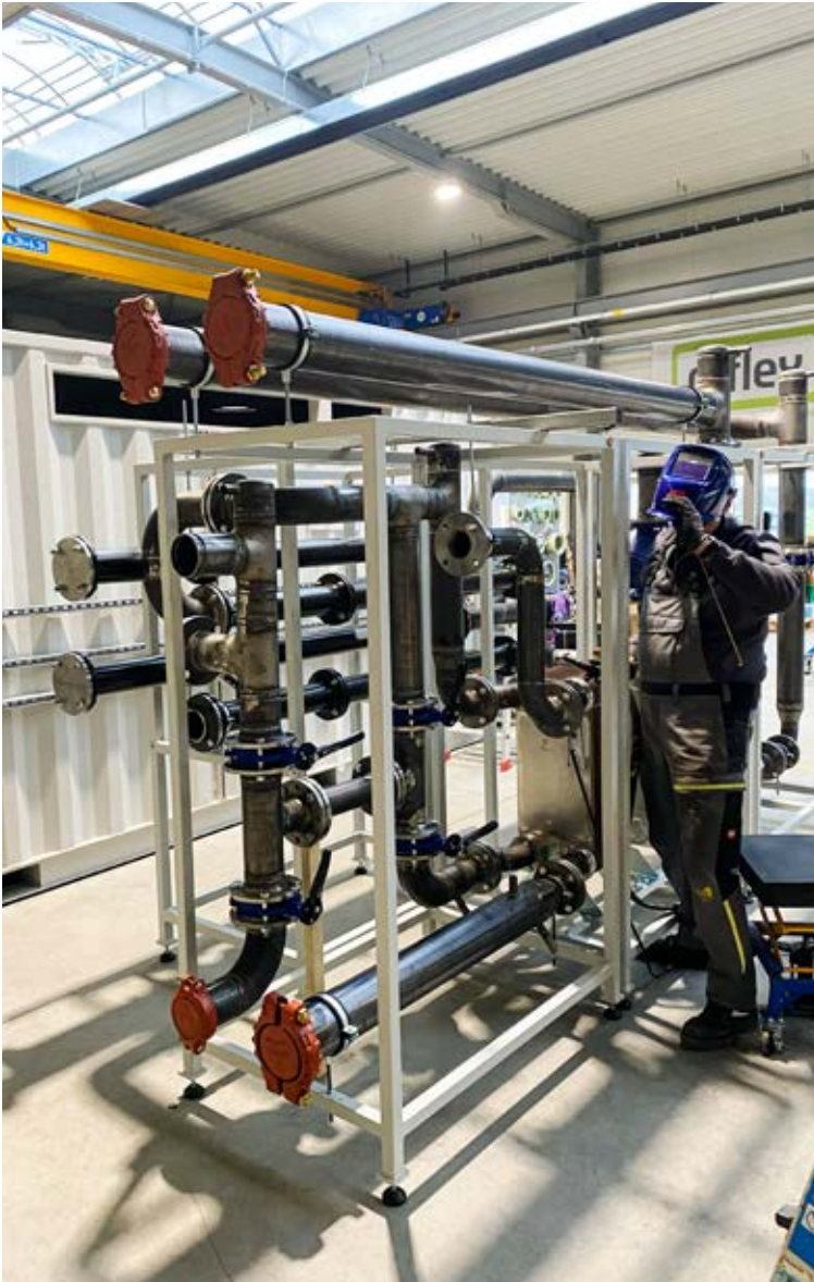
Trenn- und Verteilerstation für eine 220 KW IDM Sole-Wasser-Wärmepumpe