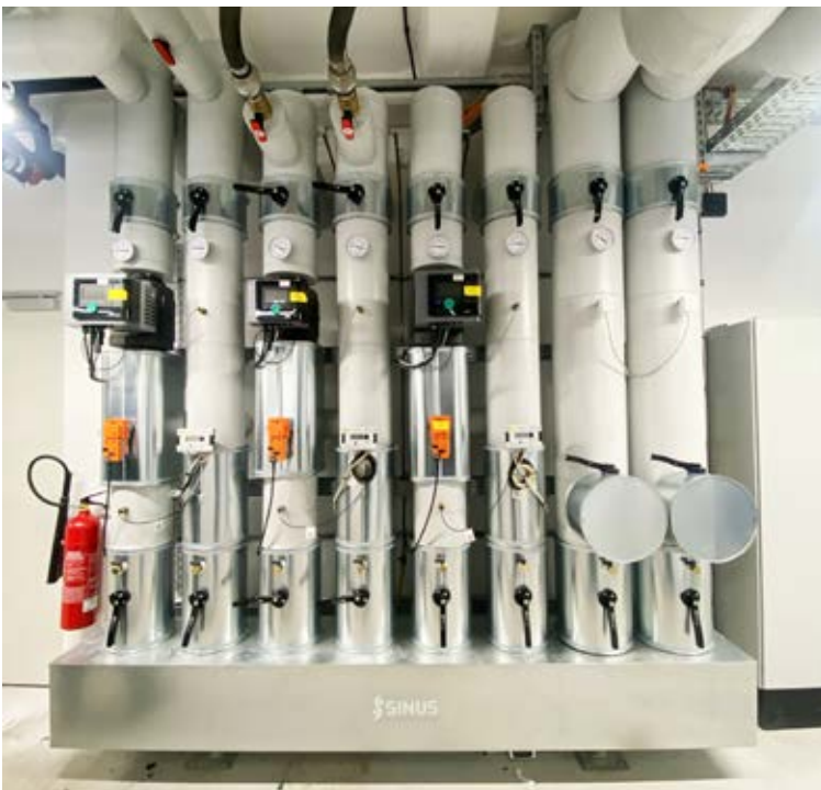
Heizen: Vorgefertigter Energieverteiler