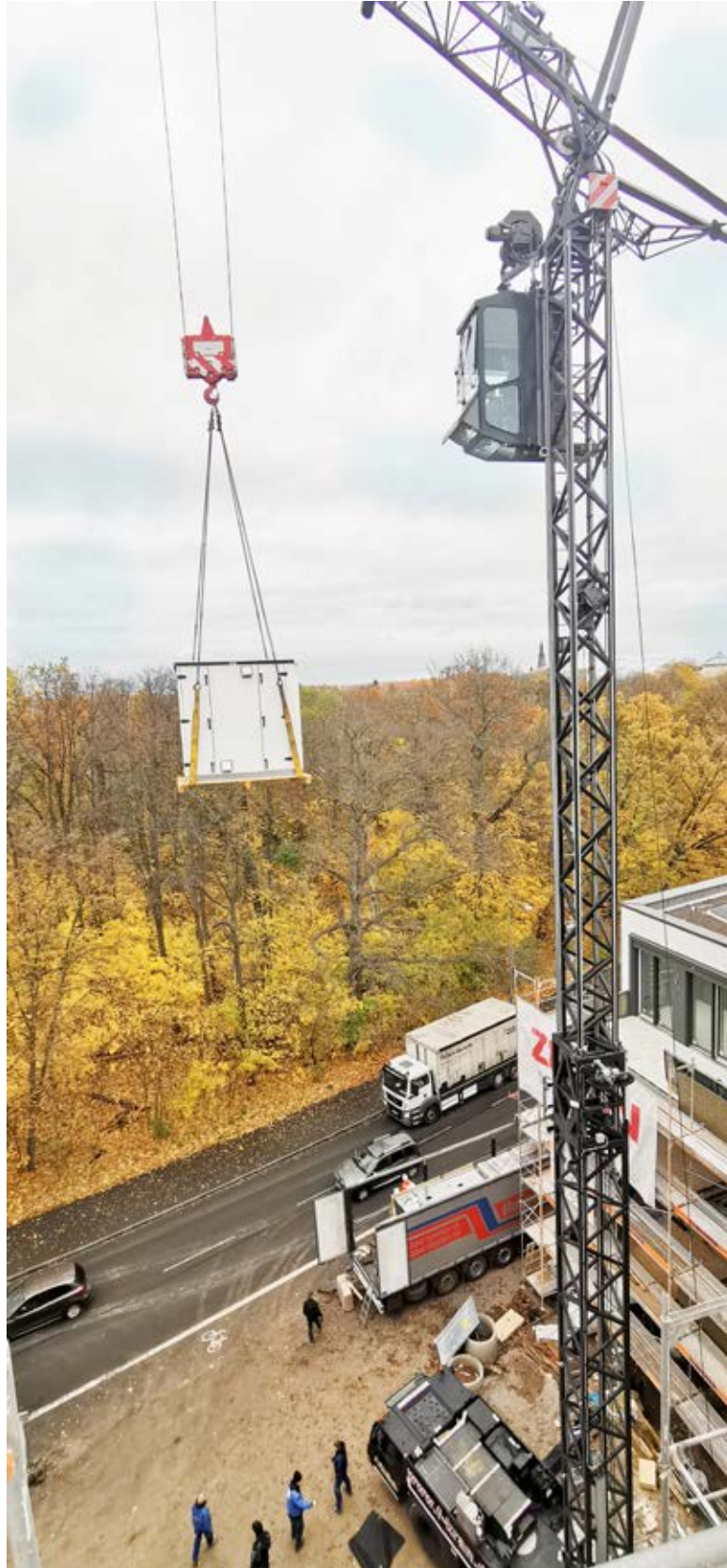
Kranung einer IDM-Trennstation in Leipzig