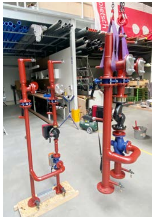
Sonderbaugruppenfertigung für ein Projekt in Bulgarien