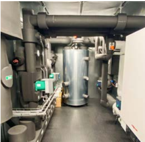
Heizen Und Kühlen: Vorgefertigte Energieverteilung in einer Container-Energiezentrale