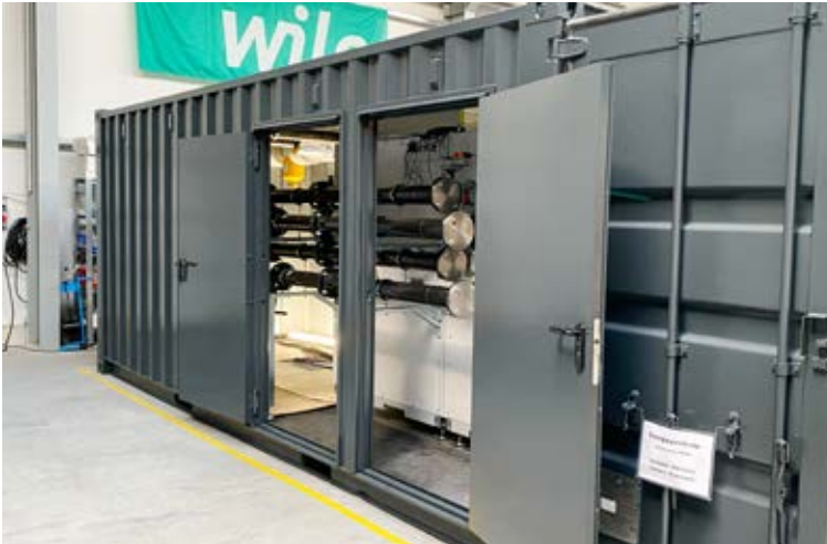
Individuelle Container Energiezentrale: für zwei IDM-Sole-Wärmepumpen Terra SW Max