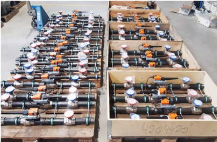
Vorgefertigte Wärmetauscher-Anschlussgruppen: für ein Projekt in Kuwait