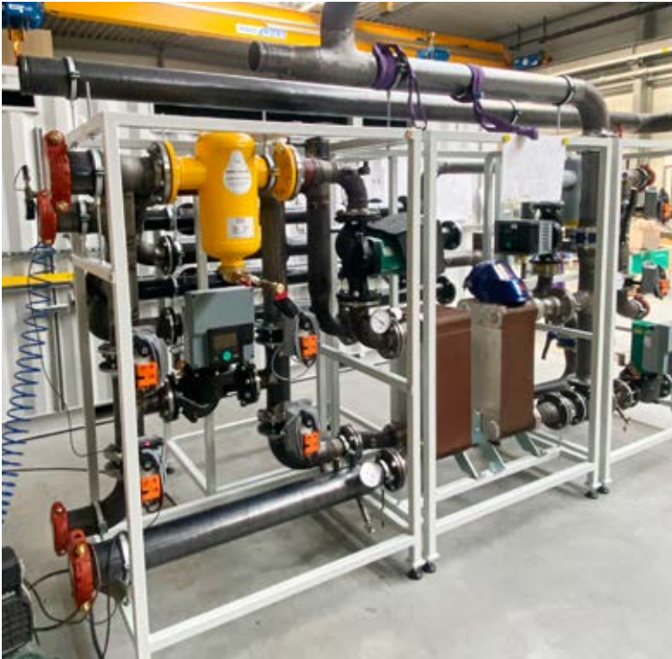
Trenn- und Verteilerstation für eine 220 KW IDM Sole-Wasser-Wärmepumpe