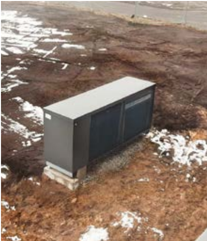
IDM-Luftwärmepumpe mit 50 KW Leistung