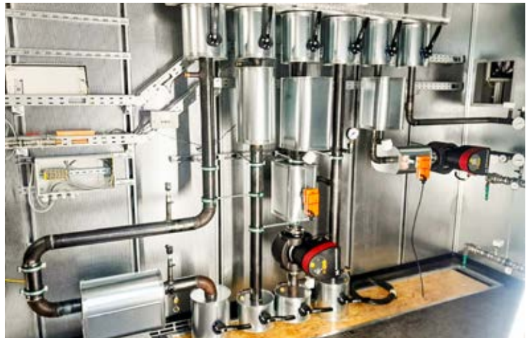
Individuell hergestellte Energieverteilung in einem Container für ein Projekt in Lettland