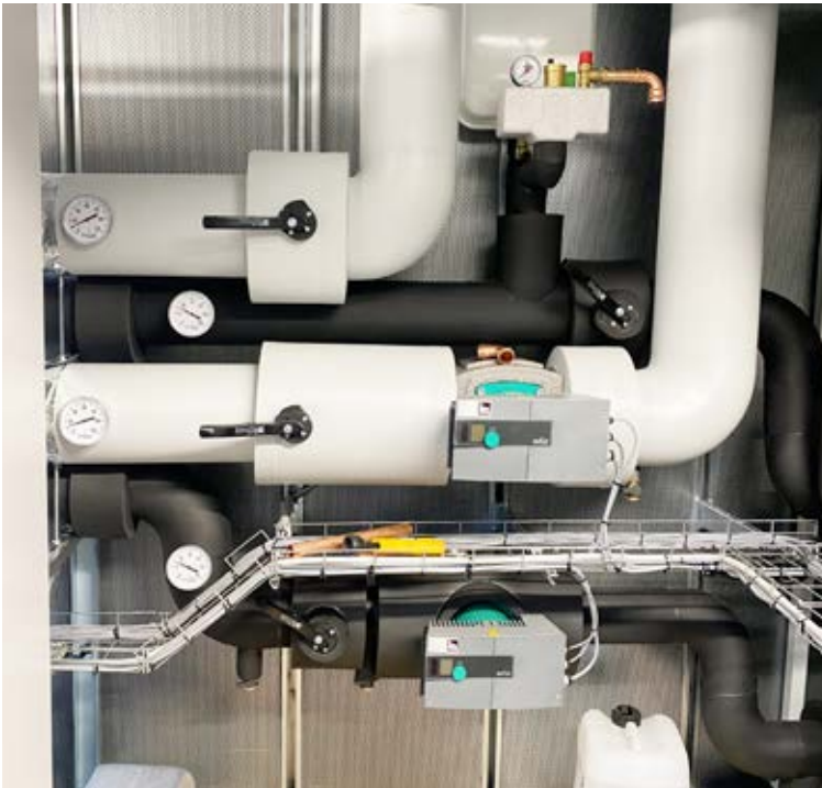
Sole- und Heizkreisseitiger Wärmepumpenanschluss